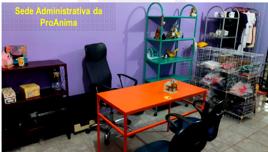
Sede Administrativa da ProAnima

A nossa Sede Administrativa é um local para encontros, reuniões, guarda de materiais e realização de eventos.