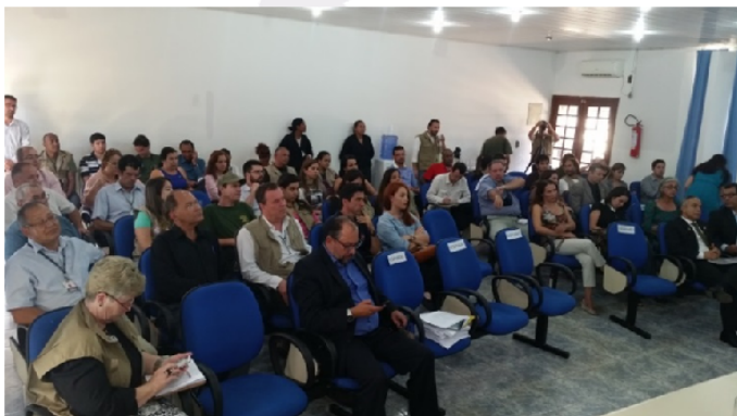
Reunião do CIPDA, 2015.

A ProAnima, como uma entidade legalmente constituída, representa a sociedade civil em algumas instâncias participativas ambientalistas. Os órgãos colegiados possuem caráter consultivo e fiscalizador, atuando em questões técnicas e financeiras. Encontram fundamento na Constituição Federal de 1988 e adotam a gestão participativa e democrática e a tomada de decisão consensual, visando a melhoria da qualidade de questões relacionadas ao meio ambiente.