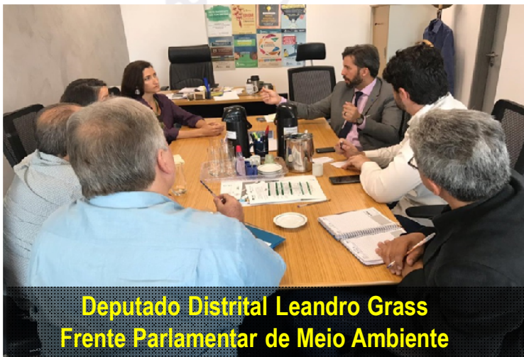
Deputado Distrital Leandro Grass Frente Parlamentar de Meio Ambiente