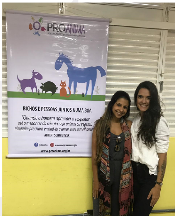
Palestra "Bichos e Pessoas Juntos Numa Boa" Escola CEM111 do Recanto das Emas – 12/06.

O Projeto PROANIMA NA ESCOLA tem como objetivo principal trabalhar com adolescentes dentro das escolas, visando a construção de uma consciência ética para a libertação animal e humana.