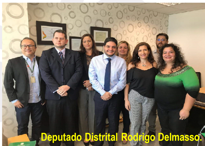
Deputado Distrital Rodrigo Delmasso.